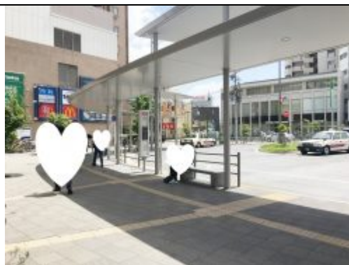
② スーパーマルエツ方向へ