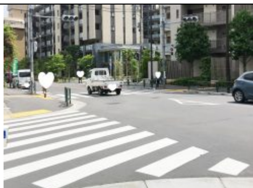
④ 一つ目の横断歩道を直進