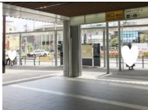
① 京王線国領駅改札を出たら左へ