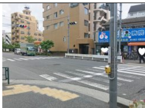
⑤ 2つ目の交差点を自転車屋さんの方に渡ってください。