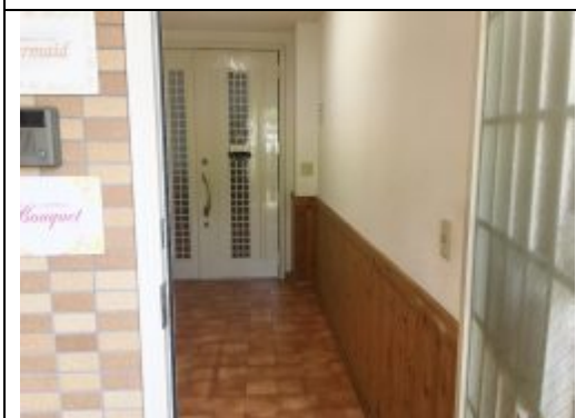
⑨ 1つ目の玄関を開けるともう一つ 白い扉