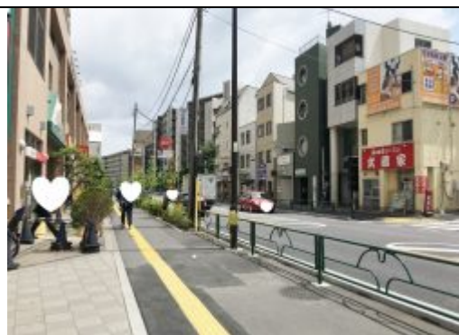
③ マルエツを通過して、狛江通り直進