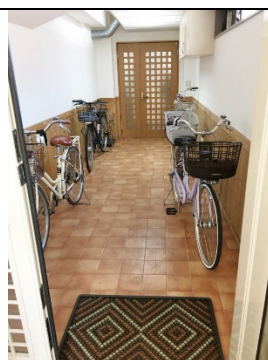
⑩ 2つ目の白い扉を開けると、屋内自 転車置き場