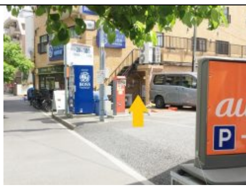
⑥ 自転車屋さんの先に au ショップとコインパーキング、その横のマンションの1階です