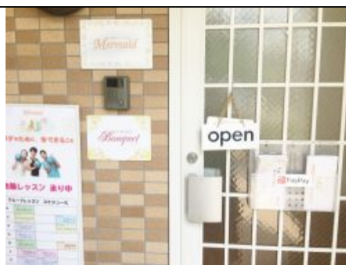
⑧ 玄関を開けてお入りください